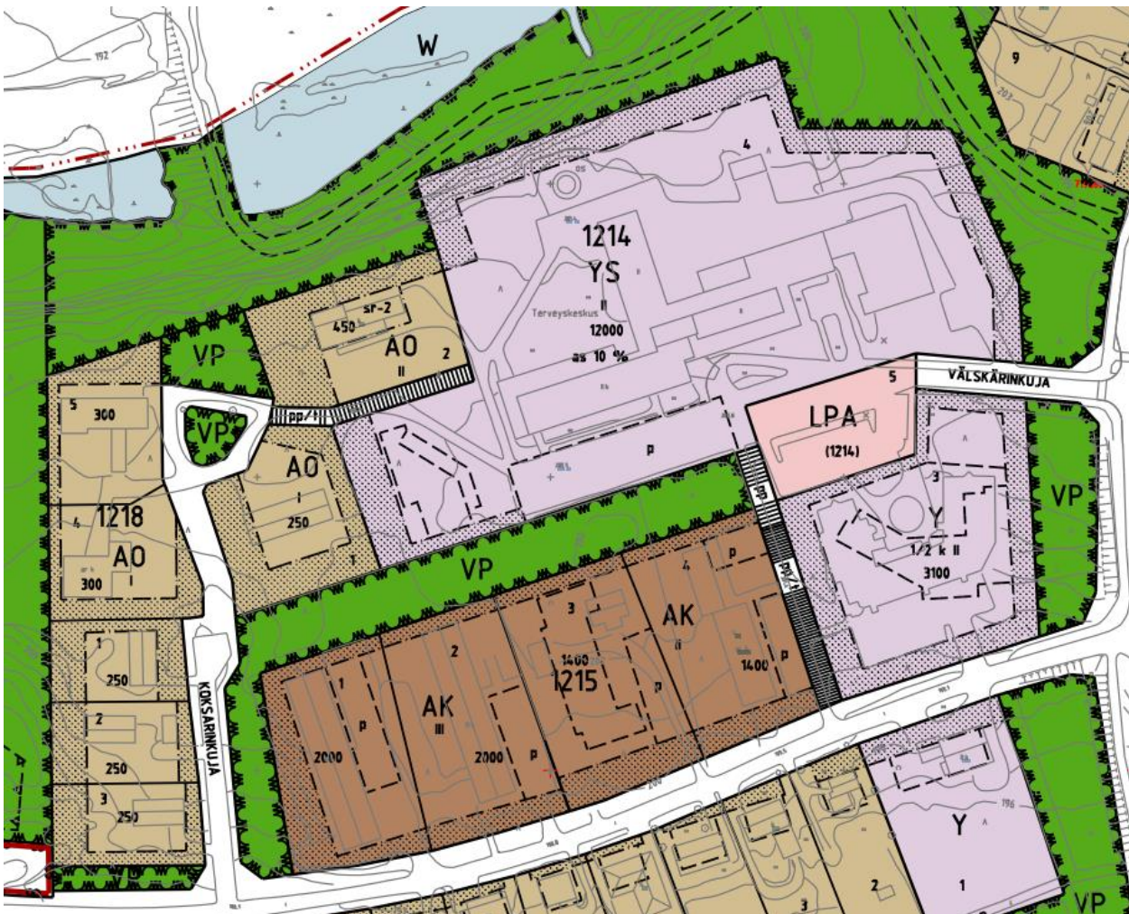
Ote Ämmänsaaren asemakaavayhdistelmästä. (Suomussalmen kunta).