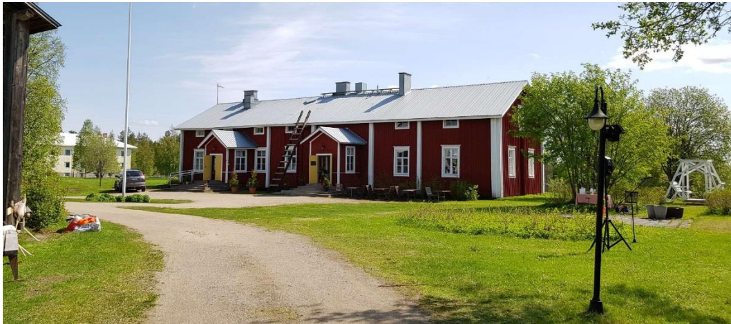
Kurimon tilan pihapiiriä.