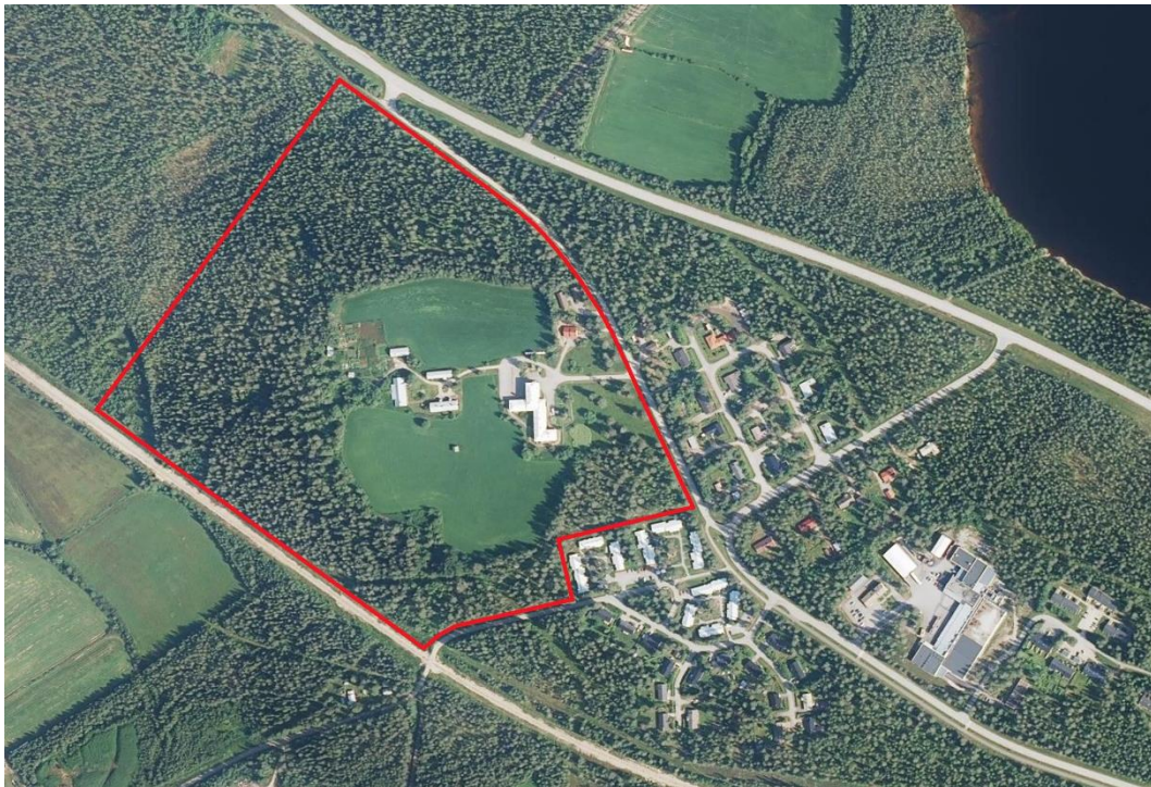
Suunnittelualueen rajaus. (Ortokuva MML Paikkatietoikkuna)

Kurimon alueella sijaitsevat kulttuurihistoriallisesti arvokas Kurimon pihapiiri sekä 1950-luvun lopulla rakennettu vanhainkoti. Kurimon pihapiirin luoteispuolella on palstaviljelyalue. Vanhainkodin koillispuolella Kurimontien varressa on työntekijöiden asunnoiksi rakennettuja rivitaloja. Kurimon vanhassa päärakennuksessa toimii tilausravintola.